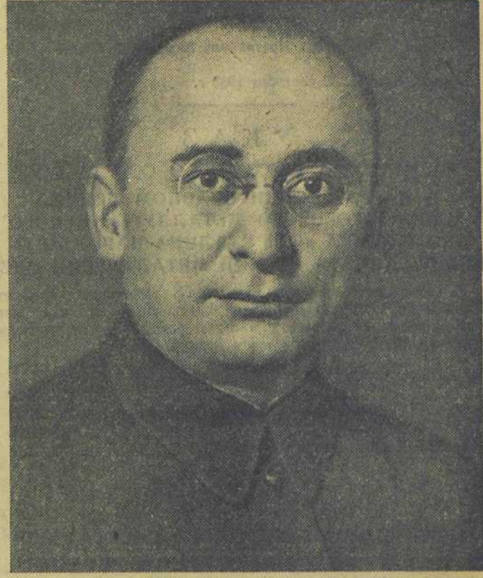
Герой Социалистического Труда Л. П. Берия